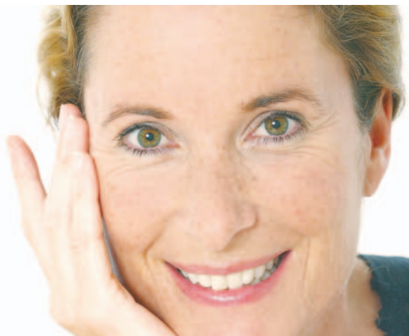
Injekce s botoxem vyjde zhruba na dva až deset tisíc korun podle rozsahu za jedno sezení.

Nejčastěji se botoxové injekce aplikují do oblasti u obočí, kolem čela nebo ze-