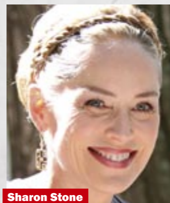
Sharon Stone Herečka a producentka (53) chce pomocí botoxu zůstat věčně mladá