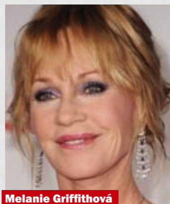
Melanie Griffithová Herečka (54) to svého času s botoxem přehnala, nyní působí její rty přirozeně