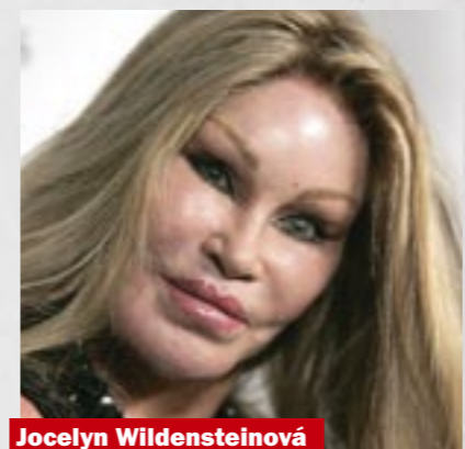
Jocelyn Wildensteinová „Kočičí žena“ (71) se na zkrášlovacích zákrocích postupně stala závislá