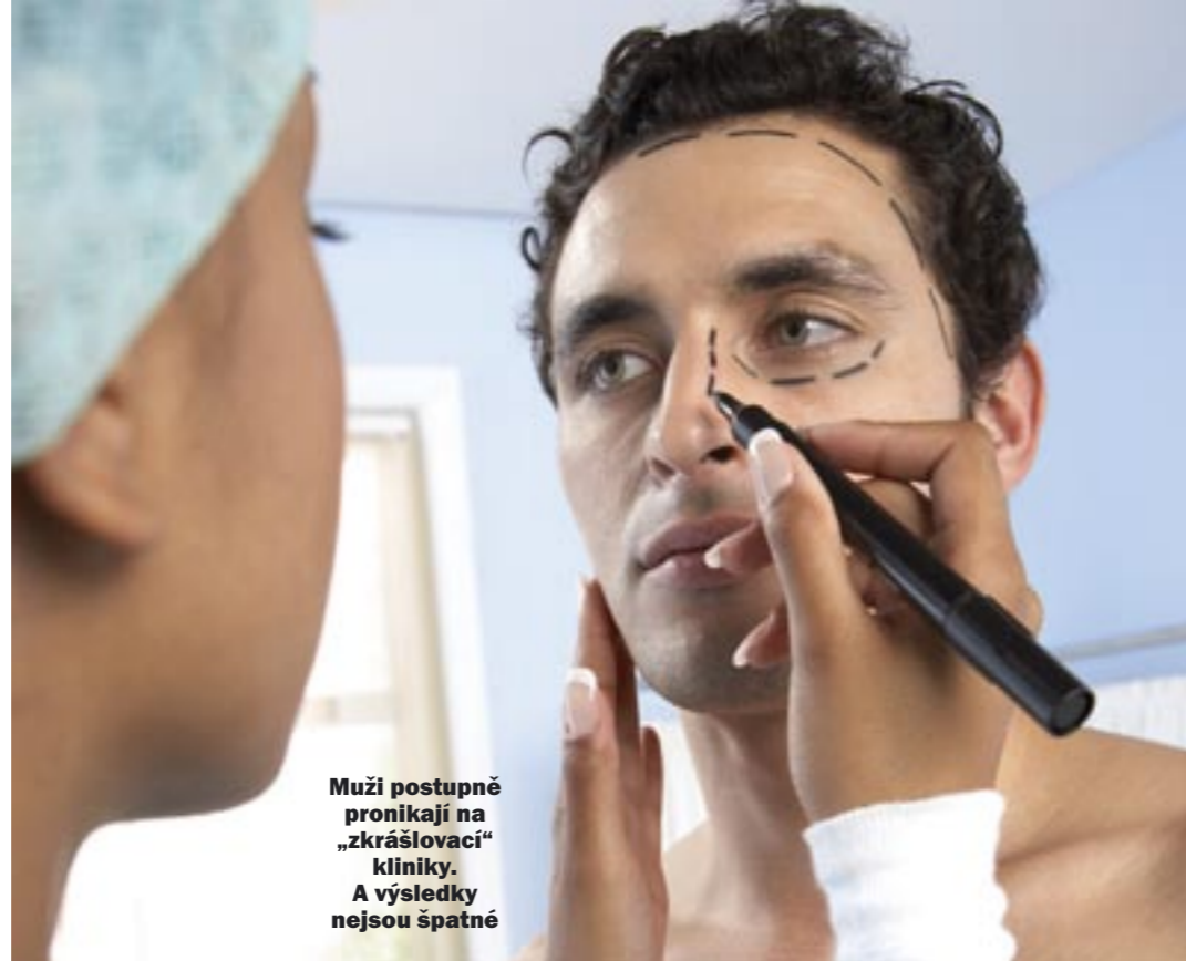
Muži postupně pronikají na „zkrášlovací“ kliniky. A výsledky nejsou špatné

Je-li řeč o krásě a botoxu ve světě, padají jména Cindy Crawfordová, Nicole