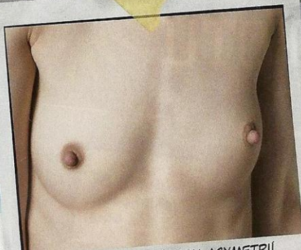
7. PLOCHÁ PRSA S MÍRNOU ASYMETRIÍ A MALÝMI DVORCI (VIZ 6). JEJICH TVAR SE SICE ASI V ČASE MOC NEZMĚNÍ, ALE ZASE VYPADAJÍ DOCELA DOBRĚ I BEZ PODPRSENKY.