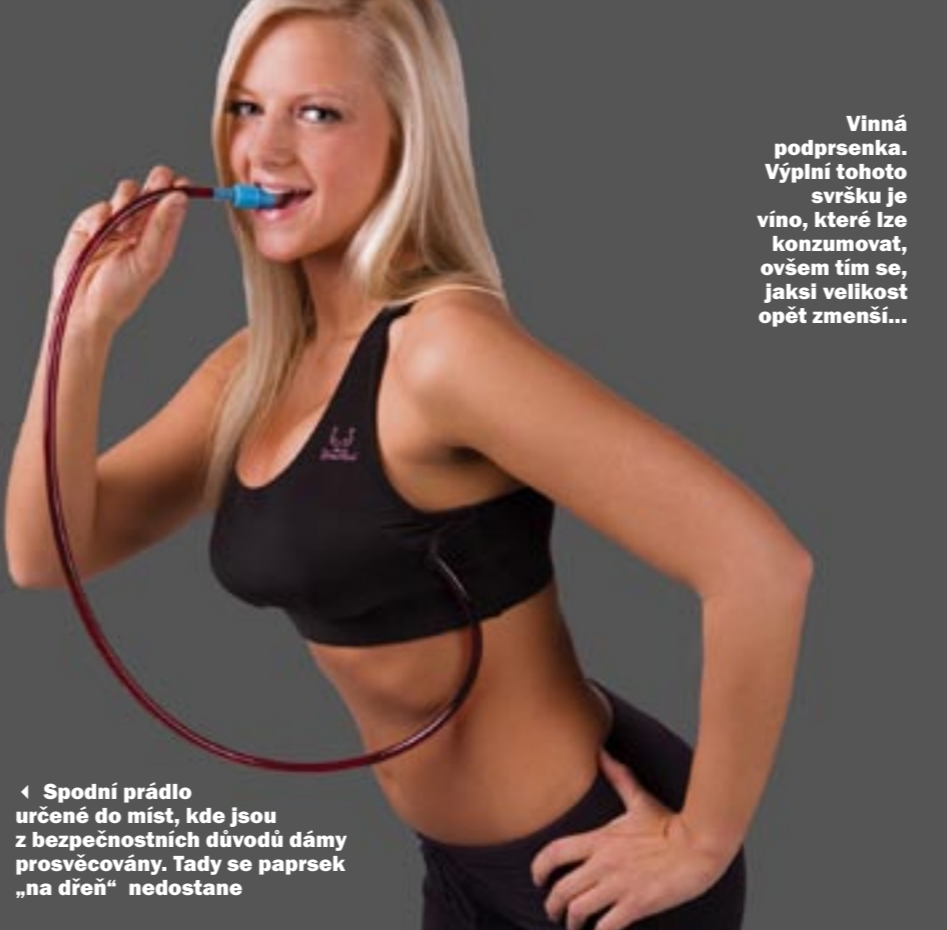
Vinná podprsenka. Výplň tohoto svršku je víno, které lze konzumovat, ovšem tím se, jaksi velikost opět zmenší...