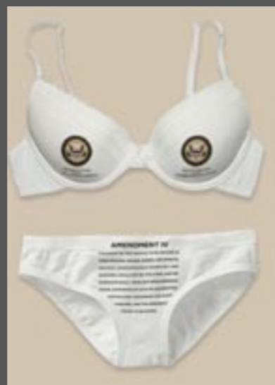
◀ Spodní prádlo určené do míst, kde jsou z bezpečnostních důvodů dámy prosvěcovány. Tady se paprsek „na dřev“ nedostane

Prsa alias ňadra, poupátka, kozy, kozičky, balony, míče, dudy... Označení se vesměs odvíjí od jejich velikosti a citové blízkosti k nim. Nejoblíbenější je u nás 75B. Písmeno označuje velikost košičku, číslo objem hrudníku.