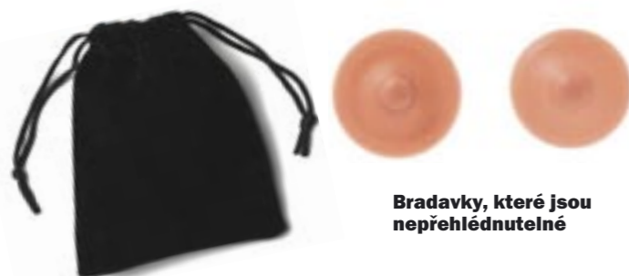
Bradavky, které jsou nepřehlédnutelné

Prsa alias ňadra, poupátka, kozy, kozičky, balony, míče, dudy... Označení se vesměs odvíjí od jejich velikosti a citové blízkosti k nim. Nejoblíbenější je u nás 75B. Písmeno označuje velikost košičku, číslo objem hrudníku.