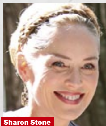
Sharon Stone Herečka a producentka (53) chce pomocí botoxu zůstat věčně mladá