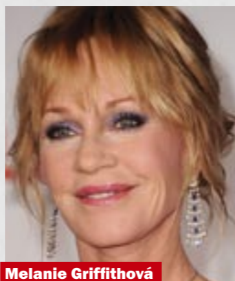
Melanie Griffithová Herečka (54) to svého času s botoxem přehnala, nyní působí její rty přirozeně