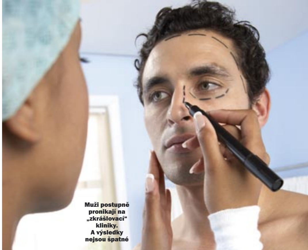
Muži postupně pronikají na „zkrášlovací“ kliniky. A výsledky nejsou špatné

Je-li řeč o krásě a botoxu ve světě, padají jména Cindy Crawfordová, Nicole