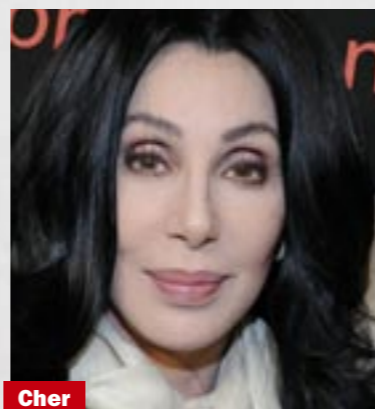
Cher Nekoronovaná královna plastik (65) vypadá už několik desetiletí stejně