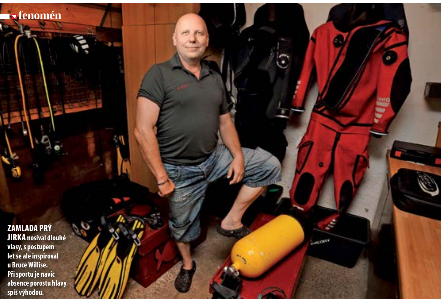
ZAMLADA PRÝ JIRKA nosíval dlouhé vlasy, s postupem let se ale inspiroval u Bruce Willise. Při sportu je navíc absence porostu hlavy spíš výhodou.